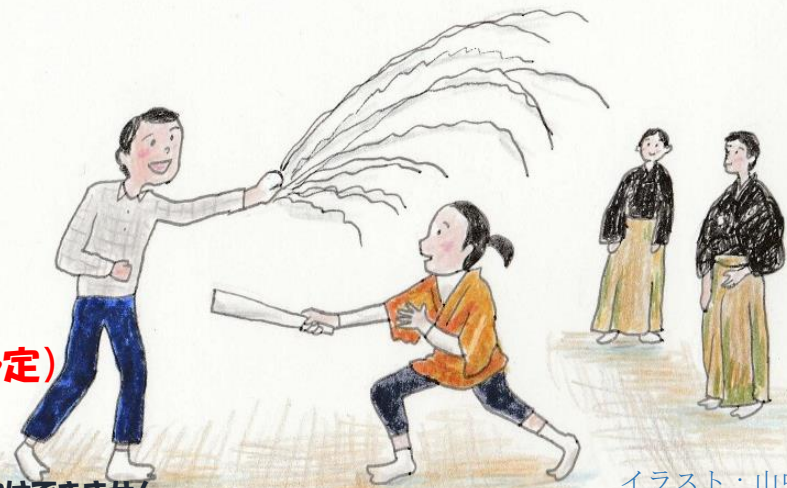
イラスト：山中桃子

2019年 11月1日(金) 開始 19:00 (開場 18:30)(約1時間30分予定)