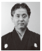
観世流シテ方 観世 喜正