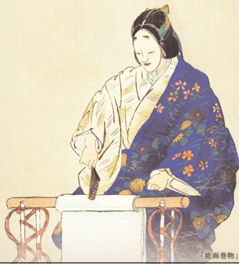
「能画巻物」