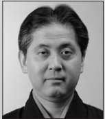
観世喜正 観世流シテ方