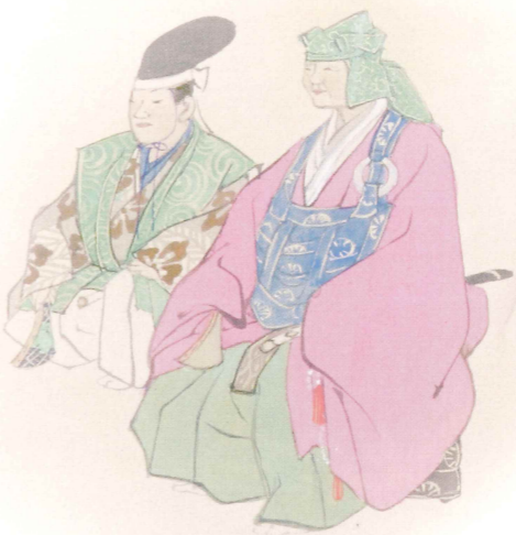
「能楽百番 月岡耕漁」能/鉢木 「能画卷物」能/鉢木