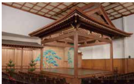
矢来能楽堂(登録有形文化財)

日本全国 能楽キャラバン! in 木曾 Nohgaku Caravan in KISO