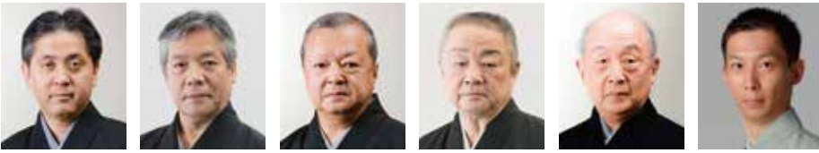
観世喜正 藤井雅之 大坪喜美雄(人間国宝) 東川光夫 山本東次郎(人間国宝) 塩津圭介